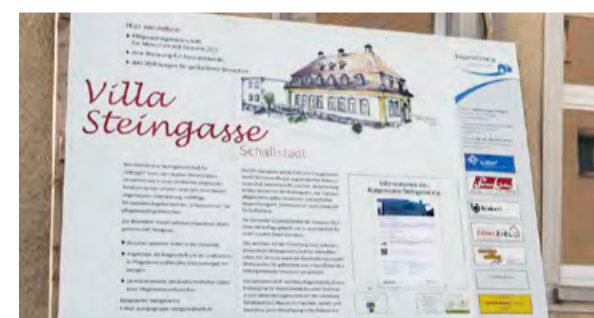
Ende der Bauarbeiten in Sicht: Schild an der „Villa Steingasse“

Der Alltag in der Pflege-WG ist ge- prägt von einem klaren Tagesablauf mit sich wiederholenden Ritualen und Abläufen. Es wird zusammen ge- kocht, gebacken, gespielt, gesungen und vieles mehr. Auch das morgend- liche Gymnastikprogramm gehört dazu und die Bewohner:innen wer- den darin gefördert, sich entspre- chend ihren Interessen und Fähig- keiten an alltäglichen Aufgaben zu beteiligen. Verloren geglaubte Fähig- keiten werden dadurch oft wieder geweckt und sie neu zu entdecken, macht allen viel Freude. Für gesell-