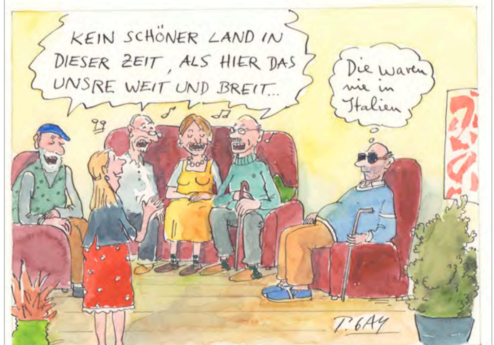
© Peter Gaymann, www.demensch.gaymann.de / Die Zeichnung stammt aus dem DEMENSCH-Kalender.