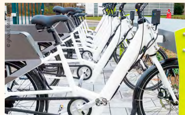
Ein Fuhrpark mit E-Bikes: Für unser Traumziel brauchen wir allerdings noch Sponsoren!

„Mit dem E-Bike komme ich oft schneller von einem Patienten zum nächsten.“